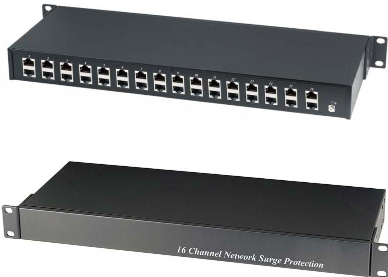
Рис.1 Внешний вид SP016P / SP016N .